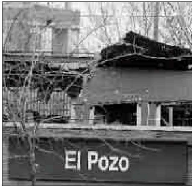
Aspecto del quinto vagón del tren que explotó en El Pozo.

El convoy está formado por dos composiciones de tres vagones cada una. En el primer vagón, justo tras la máquina, se puede apreciar el gigantesco hueco dejado por la bomba. La segunda composición del tren queda prácticamente destrozada, especialmente los coches quinto y sexto, con dos enormes boquetes que casi parten el convoy en varios trozos. La calle se va llenando de ambulancias y UVI móviles. El balance, 64 muertos.