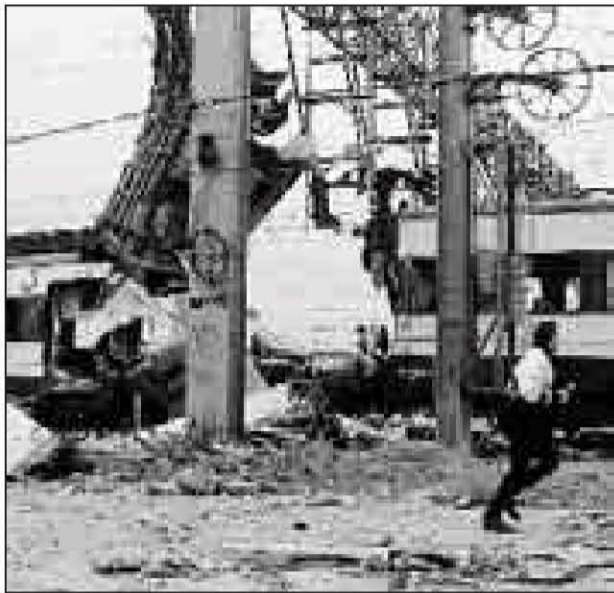
Estado del convoy siniestrado en Atocha.