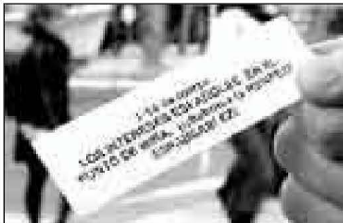
Octavillas, ayer, en San Sebastián.

Antes aun de que el ex coordinador de Batasuna, Arnaldo Otegi, negara públicamente la autoría de ETA, distintas fuentes consultadas por este diario aseguraron que no cabía descartar la acción de un grupo islámico. La ausencia de una llamada de aviso de los terroristas, previa a un atentado no selectivo -habitual