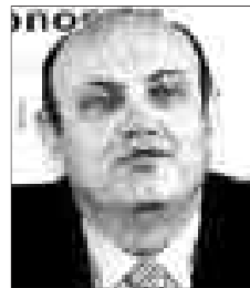
JUAN R. QUINTAS

↑ El alcalde madrileño y la presidenta de la Comunidad han estado a la altura de las circunstancias del inmenso dolor provocado por el 11-M. Ambos se han multiplicado para llevar el consuelo a las víctimas en todos los lugares del luto y han anunciado que erigirán un monumento.