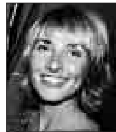
C. GUILLEN CUERVO

↓ Ahora resulta que el ilustre director manchego no cumplió con sus deberes cívicos al no presentarse a la mesa electoral en la que debía actuar como presidente. Otro polémico episodio después de que diera crédito al rumor de un golpe de Estado, por lo que hoy se ha disculpado.