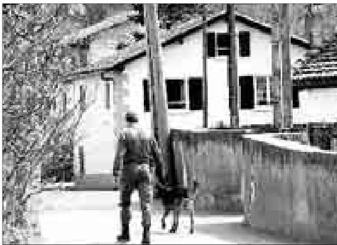
Un policía francés patrulla junto a la casa de Saint-Pé.

Precisamente en el caserío donde se ocupaba del ganado, una vieja casona descuidada, es donde la Gendarmería encontró el arsenal de ETA. En un desvencijado cobertizo de maderas roídas por la carcoma, entre un tractor y una bicicleta, se ocultaba la cueva de Ali Babá de los terroristas.