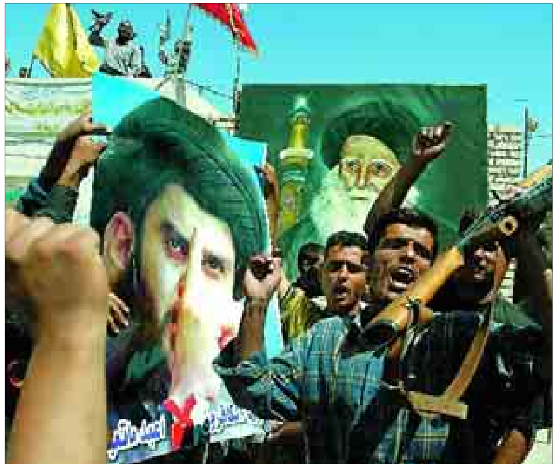
Musulmanes chiíes gritan eslóganes antiamericanos con imágenes de Muqtada al Sadr y de su padre, ayer en Bagdad.