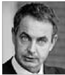
J. L. R. ZAPATERO

Una reacción institucional ponderada y de altura