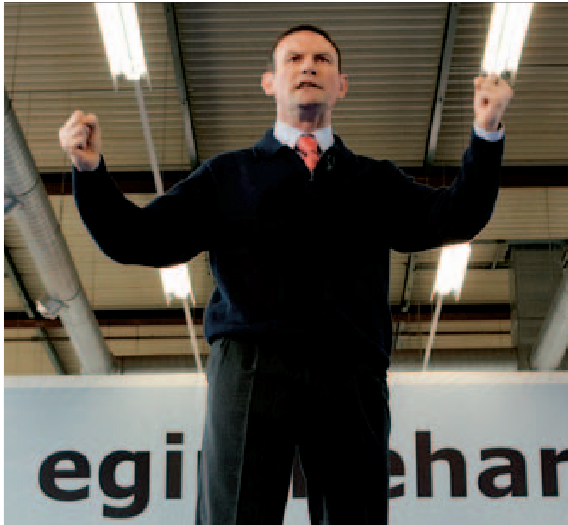
El 'lehendakari' gestacula durante el acto de presentación de los candidatos municipales y forales del PNV en Durango.

Sigue en página 10 Editorial en página 5