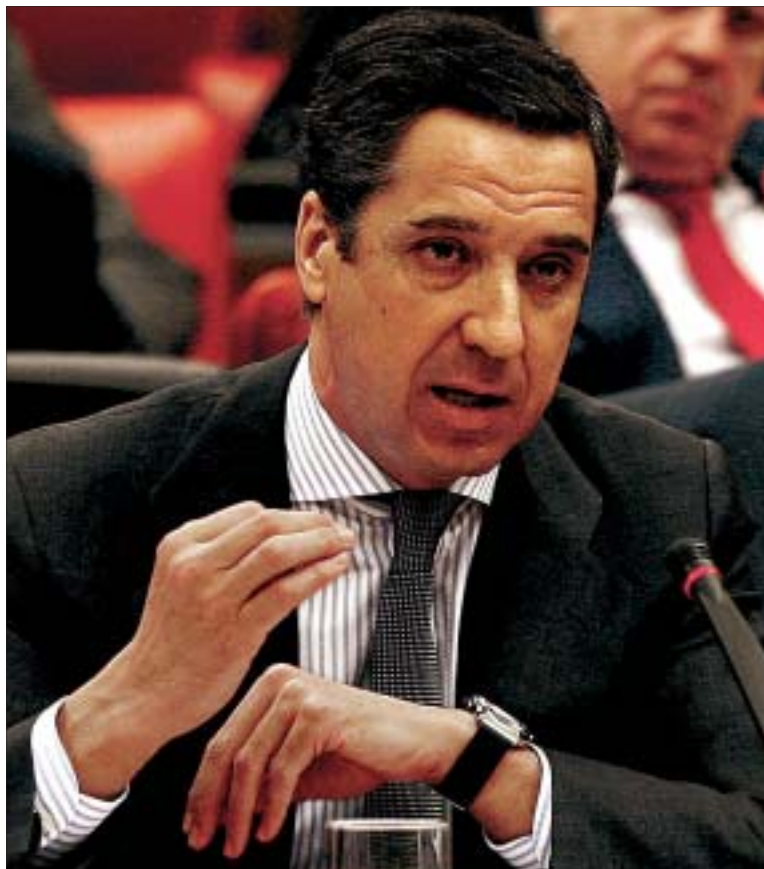
El portavoz del PP, Eduardo Zaplana, ayer, en plena intervención.

ARGEL.- El Rey de España abogó ayer en Argelia por la «libre determinación» del pueblo saharauí como elemento clave para la «solución política justa y duradera» del conflicto, que debe ser «mutuamente aceptable» por las partes y a la que éstas deben llegar «a través del diálogo en el marco de la ONU». Don Juan Carlos pronunció estas palabras durante el almuerzo oficial que le ofreció el presidente argelino en el Palacio del Pueblo. Sigue en página 21