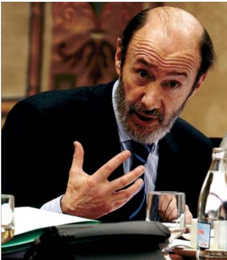
El ministro Alfredo Pérez Rubalcaba, ayer, en la Comisión de Interior del Congreso.