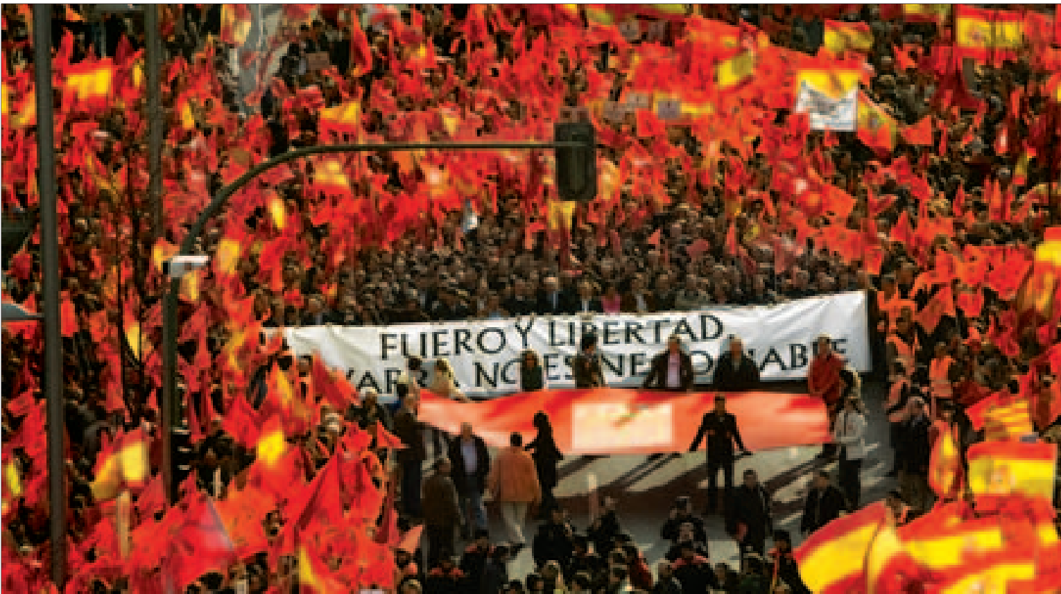
Cabecera de la manifestación celebrada ayer en el centro de Pamplona bajo el lema 'Fuero y libertad. Navarra no es negociable'. / IÑAKI ANDRÉS/MITXI

Quiere que sean todas sustituidas por las de bajo consumo / NUEVA ECONOMÍA