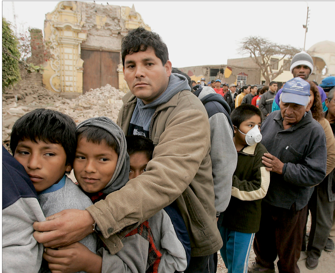
Niños de la destruida ciudad de Pisco (Perú), ayer, haciendo cola para recibir ayuda.

EL MUNDO donará el 10% (10 céntimos) del precio de portada de cada ejemplar vendido entre hoy y el sábado. www.elmundo.es publicará hoy el número de cuenta donde se reunirán los donativos del diario y sus lectores