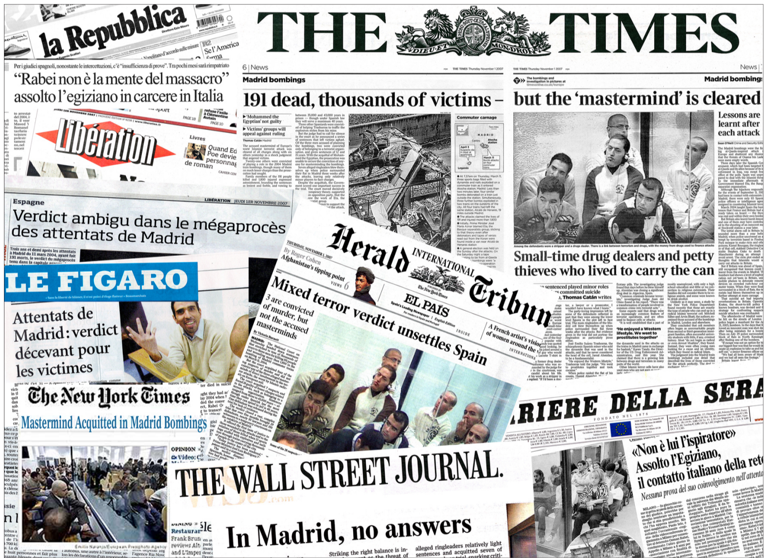
Reproducción de algunos de los principales titulares de los grandes periódicos internacionales que ayer hacían referencia a la absolución de los 'cerebros' del 11-M.

Por su parte, José Blanco acusó a Aznar de ser el «autor intelectual del engaño masivo del 11-M», mientras Zaplana exigía al PSOE que admitiera que «Irak no ha sido» la causa del 11-M. Páginas 8 a 11 Editorial en página 3