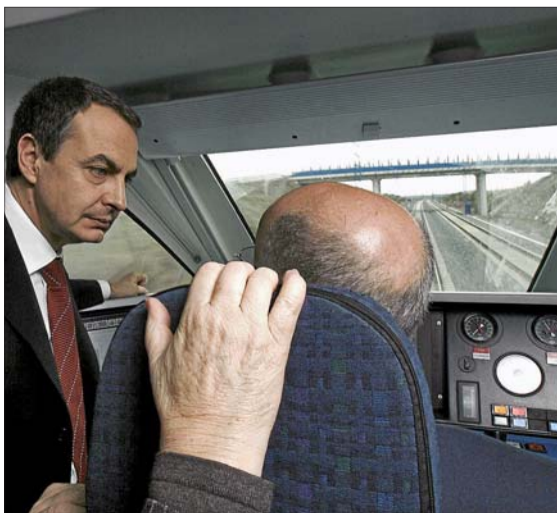
Zapatero, ayer, en la cabina del AVE Madrid-Valladolid.