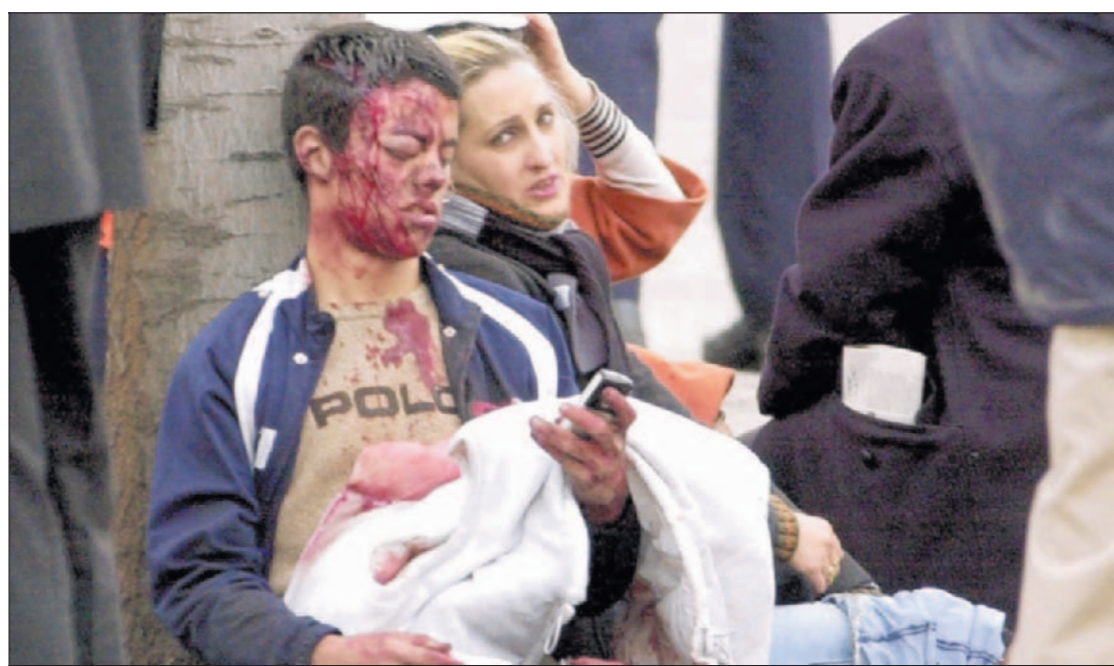
Gewond, maar tenminste nog in leven. Een van de slachtoffers van de aanslagen brengt via sms zijn dierbaren op de hoogte van zijn toestand.