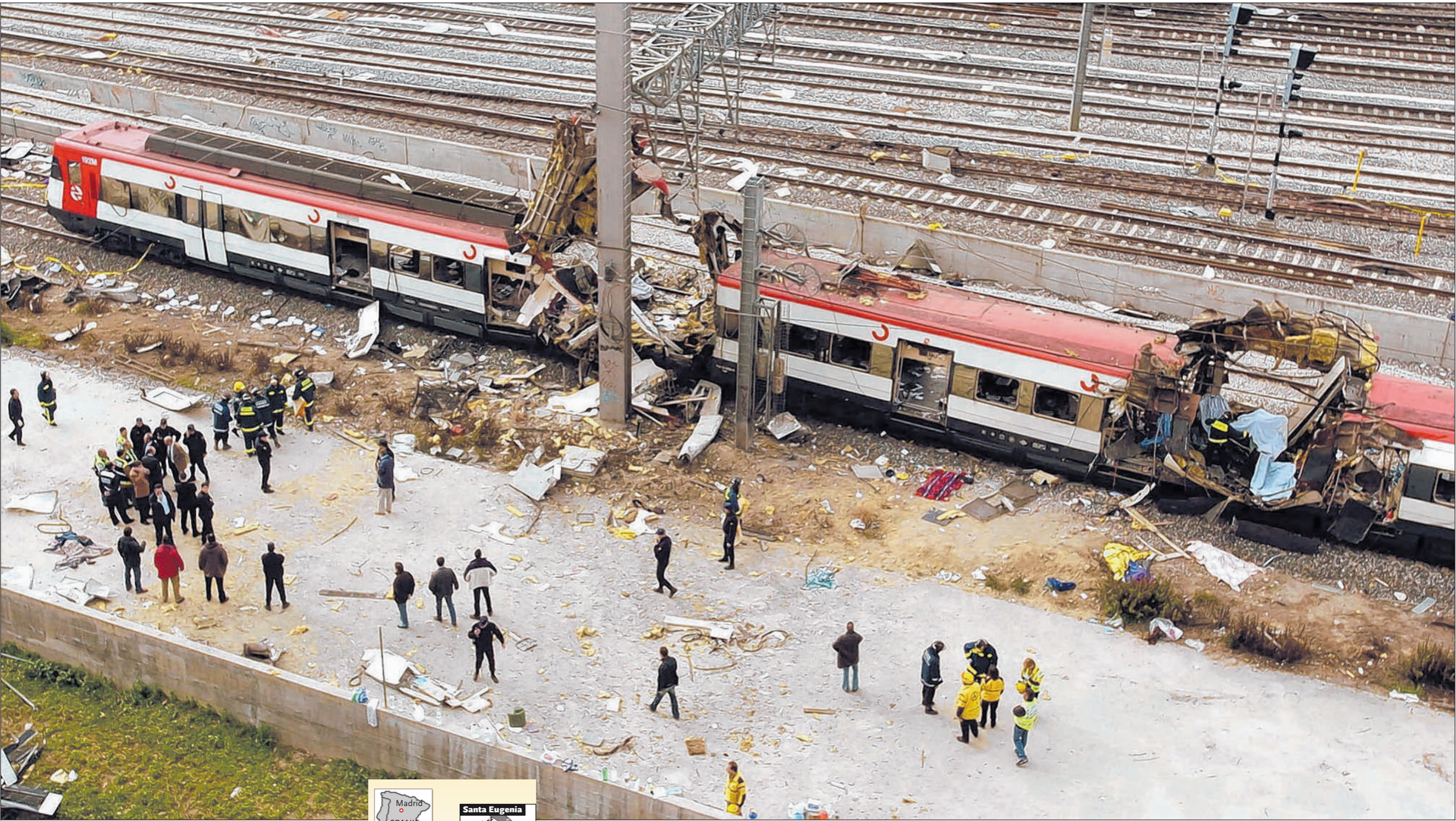
Toen de rookwolven waren opgetrokken en de overlevenden waren afgevoerd, bleef de forensentrein uit Gualdalajara met gapende wonden achter op het station Atocha.

● 'Operatie Dodemanstrein' kost zeker 190 doden ● 10 explosies in 4 minuten ● Verkiezingen gaan door