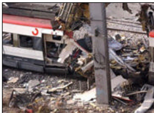
Imagen de uno de los trenes tras estallar el explosivo

Las deflagraciones, de las que no se recibió aviso alguno, ocurrieron de forma casi simultánea en un tren detenido en la estación de Atocha, en otro que circulaba junto a la calle Téllez, y en sendos convoyes de la línea que comunica Madrid con el corredor del Henares cuando se encontraban en las estaciones de El Pozo del Tío Raimundo y Santa Eugenia.