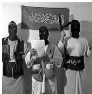
Imagen de los autores del 11-M en el vídeo reivindicativo dejado en la mezquita de la M-30

La organización terrorista Al Qaeda reivindicó los atentados a través de una carta enviada al diario árabe con sede en Londres Al Quds Al Arabi, órgano habitual de los comunicados de Al Qaeda. «Hemos logrado infiltrarnos en el corazón de Europa de las cruzadas, y golpear una de las bases de la alianza de las cruzadas», señalaba la misiva firmada por las Brigadas Abu Hafs Al Masri, que anteriormente habían reivindicado los atentados contra las sinagogas de Turquía y el perpetrado contra la ONU en agosto en Bagdad. El grupo terrorista denominó a la operación «los trenes de la muerte».